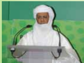
Brigi RAFINI , Premier ministre, chef du gouvernement de la République du Niger