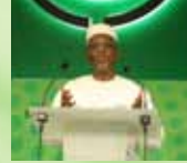
Abdallah BOUREIMA , Président de la Commission de l'UEMOA