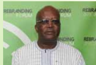
Roch Marc Christian KABORÉ Président du Burkina Faso