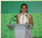
Audrey PULVAR , Présidente de la Fondation pour la Nature et l'Homme