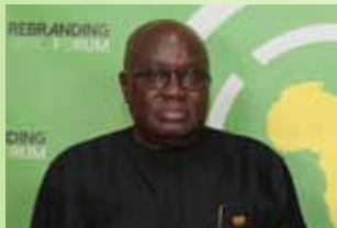
Nana AKUFO-ADDO Président du Ghana