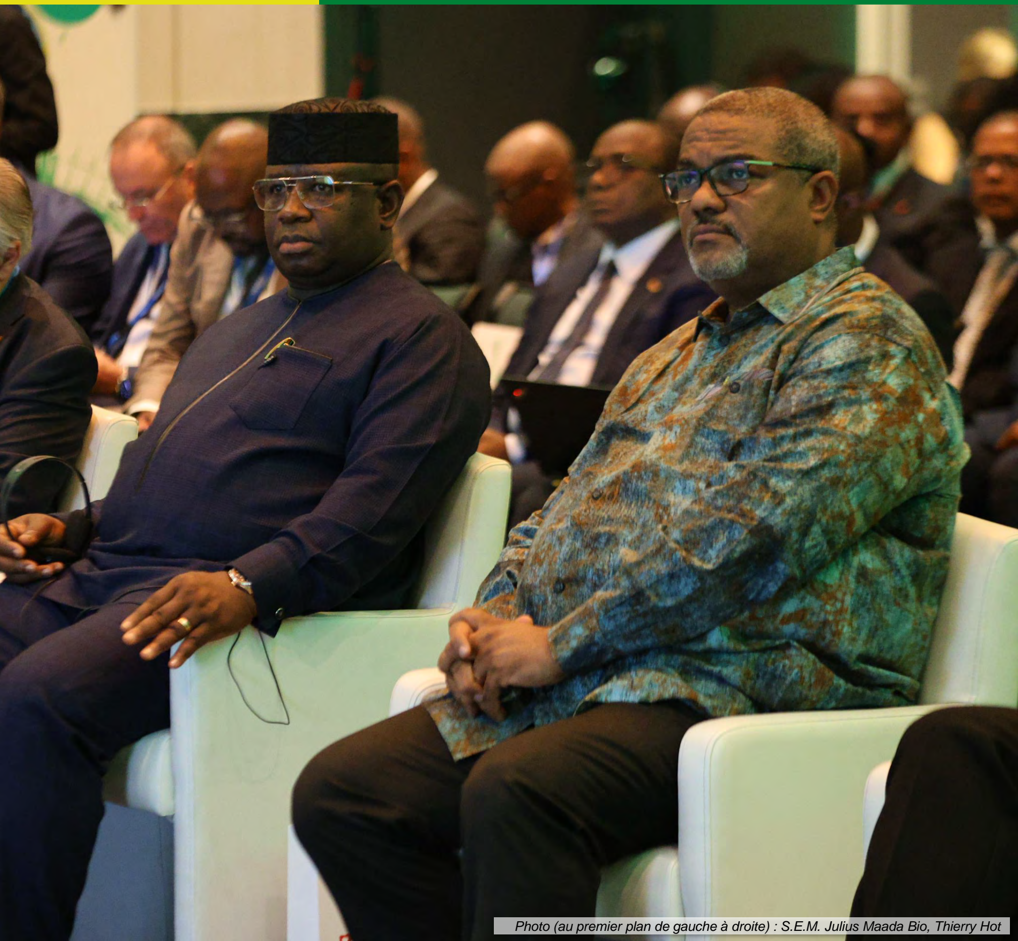
Photo (au premier plan de gauche à droite) : S.E.M. Julius Maada Bio, Thierry Hot