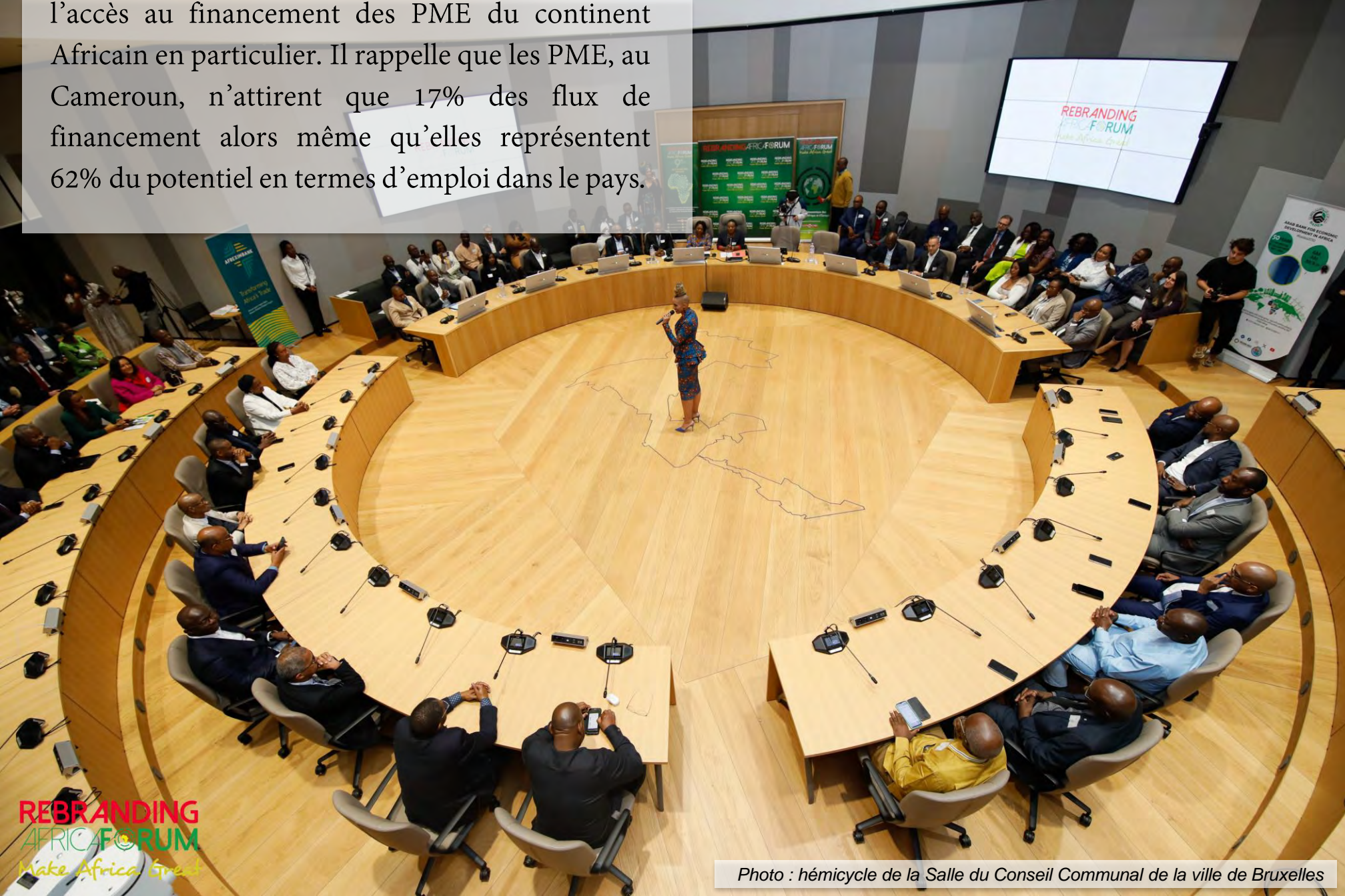
Photo : hémicycle de la Salle du Conseil Communal de la ville de Bruxelles