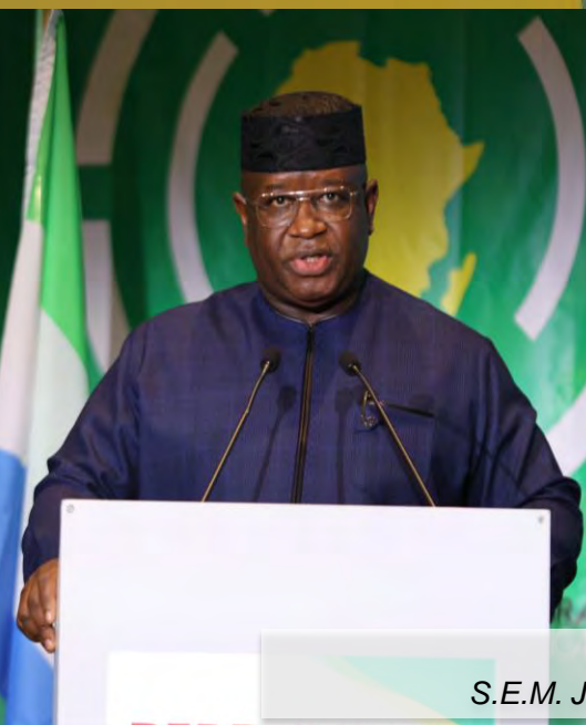
Photo : S.E.M. Julius Maada Bio